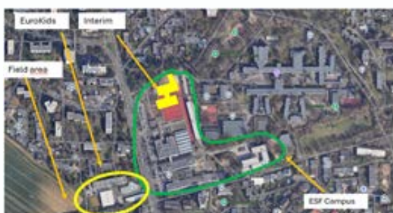
Update on building situation