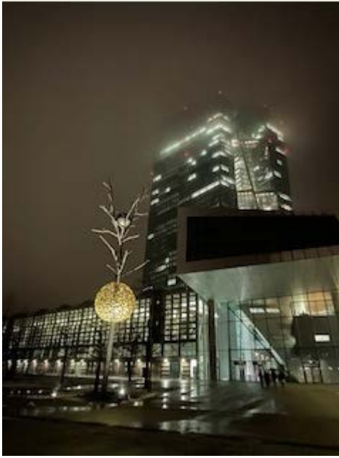
Neujahrsempfang der EZB für ESF-Mitarbeiter