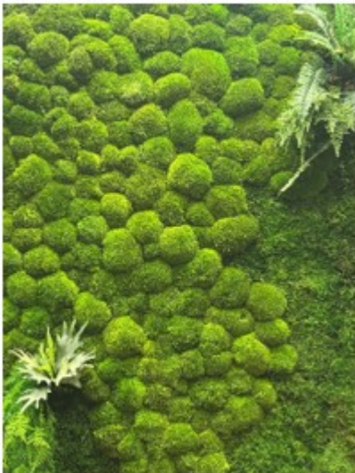
Grüne Wand in der EZB Bibliothek